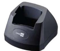
Ladegerät & Kommunikationscradle