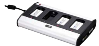
Ladegerät für 4 Batterien